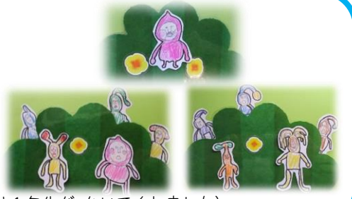
(イラストは1年生が 書いてくれました)

10人のこびとがわくわく館のホールとろうかにかくれているよ！ みんなでさがしてみよう★ 毎週日曜日にかくれ場所が変わるよ♪